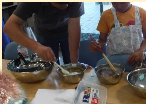
かき混ぜてよく溶かします。