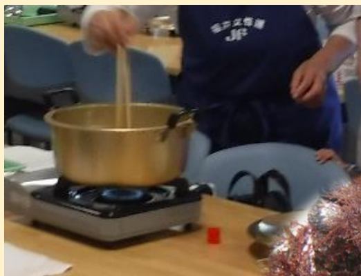
海藻を煮溶かします。

【主催】 福井県海浜自然センター 【連携】 福井ライフ・アカデミー、福井大学CST