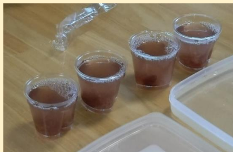
海藻ゼリーの完成。