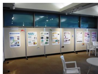
福井県の水産研究