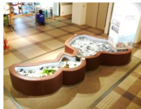
福井の海にタッチしよう