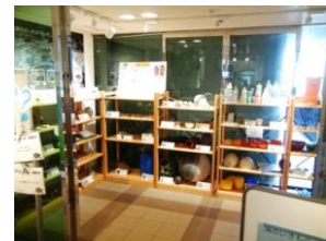
ビーチコーミング