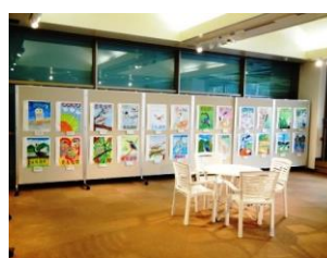
平成 30 年度愛鳥週間用ポスター原画コンクール入賞作品展