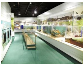
三方五湖とその周辺の生きもの