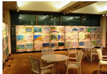
三方五湖自然再生協議会「昔の水辺の風景」絵画作品展