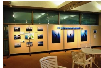
写真展「一息で挑戦！若狭の海とフリーダイビング」