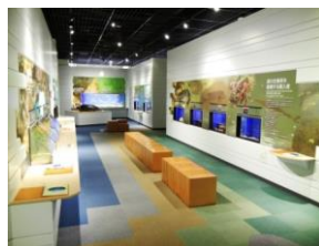
若狭湾の生きものたち