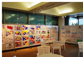
ほのぼのの幼児絵画展