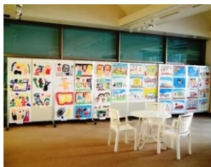
ほのぼの幼児絵画展