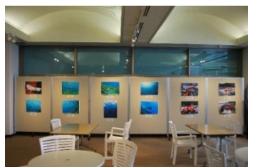
福井の海に親しむ会 写真展 「スノーケリングで見られる若狭の海の美しい景観と生きものたち」