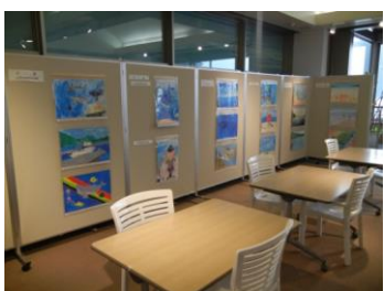
小浜海上保安署 絵画展 「第17回未来に残そう青い海・図画コンクール作品」