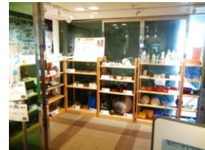
ビーチコーミング